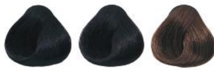
1/70 Blue black Negro Azabado Noir bleuté 烏黑藍色 藍黑色 烏黑 藍黑色 烏黑 藍黑色 烏黑 藍黑色