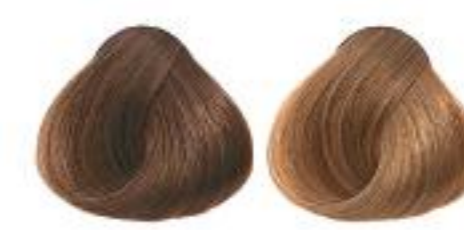
7/00 Medium blonde Rubio medio Blond moyen 特深金黃色 特深金黃色 特深金黃色 特深金黃色

100 natural natural natural 自然色 自然色 自然色 自然色 自然色 自然色