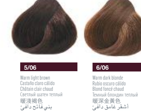
5/06 Warm light brown Castaño claro cálido Châtain clair chaud 淺灰淺褐色 淺灰淺褐色 淺灰淺褐色 淺灰淺褐色 淺灰淺褐色 淺灰淺褐色

106 warm natural natural cálido natural chaud 暖自然色 暖自然色 暖自然色 暖自然色 暖自然色 暖自然色