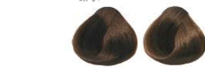
6/17 Blue ash dark blonde Rubio oscuro ceniza metálica Blond foncé cendré métallique 深灰深金黃色 深灰深金黃色 深灰深金黃色 深灰深金黃色

17 blue ash ceniza ocrea пепельный 冷灰色 冷灰色 冷灰色 冷灰色 冷灰色 冷灰色