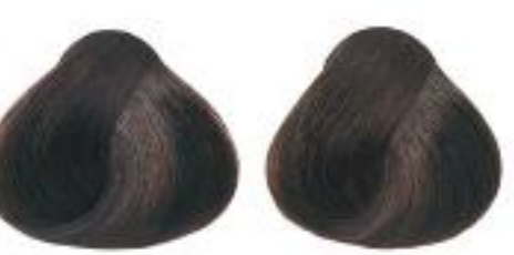
4/00+ Intense medium brown Castaño medio intenso Châtain moyen intense 加強中等褐色 加強中等褐色 加強中等褐色 加強中等褐色