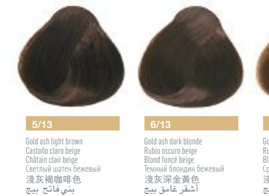
5/13 Gold ash light brown Castaño claro beige Châtain clair beige 淺灰淺褐色 淺灰淺褐色 淺灰淺褐色 淺灰淺褐色 淺灰淺褐色 淺灰淺褐色

13 gold ash beige beige бежевый 金褐色 金褐色 金褐色 金褐色 金褐色 金褐色