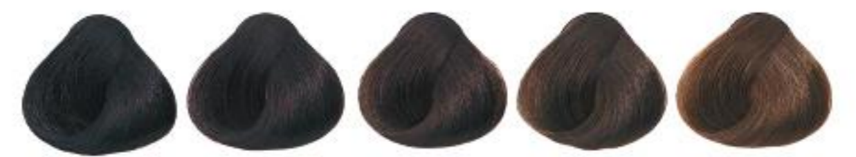
1/00 Black Negro Черный 黑色 黑色 黑色 黑色 黑色 黑色